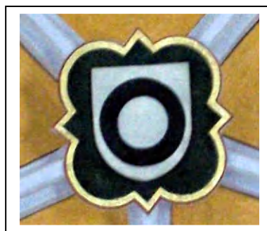
Westendorferwappen im Gewölbe der in der Pfarrkirche Vilsbiburg