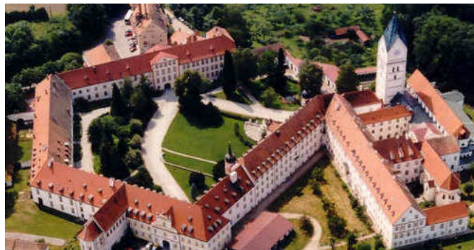
| Die Benediktinerabtei Scheyern 4

Am 9. Oktober 1215 wurde die Basilika des Klosters Scheyern geweiht. Dies geschah nach dem Wiederaufbau unter Leitung von Abt Baldemar (1171-1203) von den Zerstörungen durch Brände in den Jahren 1171 und 1183. Im Laufe der Zeit folgten mehrere Umbauten, wodurch die Kirche im Stil des 18. Jahrhunderts erscheint. Durch Abt Joachim Herpfer erhielt die Basilika bei Umbauten Spätrokoko-Elemente. Im 19. Jahrhundert wandelte sich das Bild der Kirche durch eine schneidende Umgestaltung im Stil der Neuromantik. Der Barock erscheint somit nur noch an Restplätzen. 3