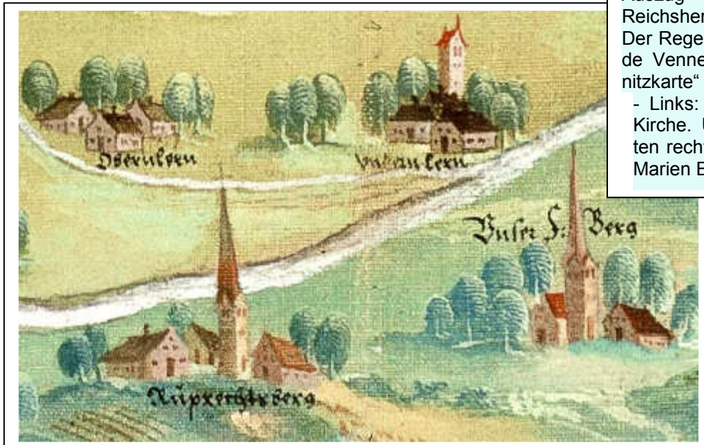
Auszug aus der Wildbankkarte der Reichsherrschaft Fraunhofen. Der Regensburger Maler Hieronymus Van de Venne hat 1584 diese „Wildbankgranzkarte“ gefertigt. - Links: Oberlern. Rechts Unternlern mit Kirche. Unten links Ruprechtsberg. Unten rechts Unser S: Berg = Unser Sankt Marien Berg.