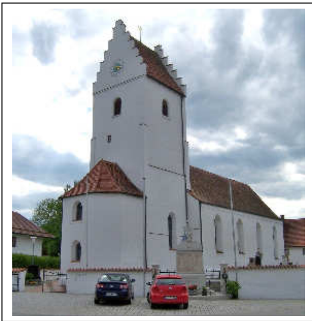
Pfarrkirche Sankt Ulrich in Untervilslern, Foto: Peter Käser, 2014.

Eine gut ausgebildete neue Generation an Geistlichen, brachte nach dem von 1545 bis 1563 dauernden Konzil von Trient im katholischen Herzogtum Bayern in vielen Pfarreien wieder eine Beruhigung und neue Kontinuität für die römisch-katholische Kirche.