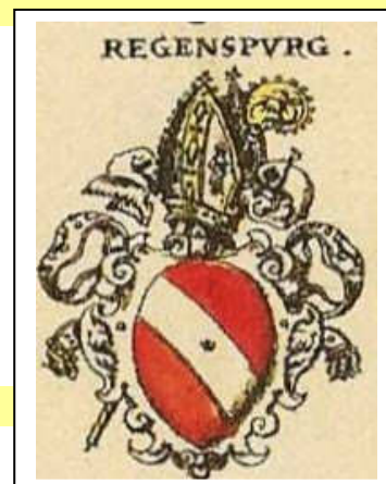
Das Wappen des Hochstiftes Regensburg mit Mitra und Bischofsstab

Bischof Rupert II. von Regensburg, der Sohn des Pfalzgrafen Friedrich von Sponheim, hat ihn in der St. Emmeramskirche begraben.